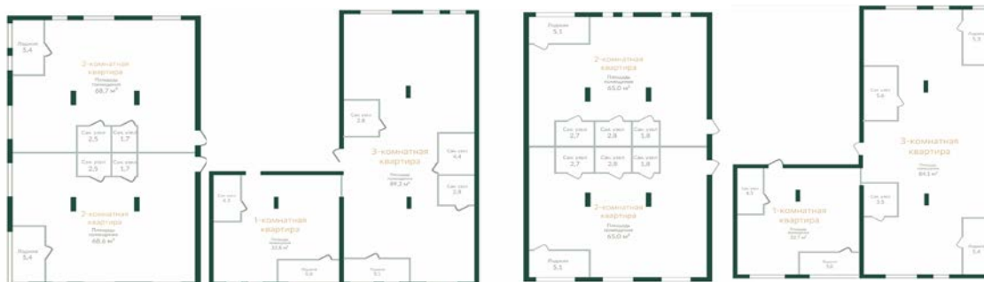
Вид на внутренний двор